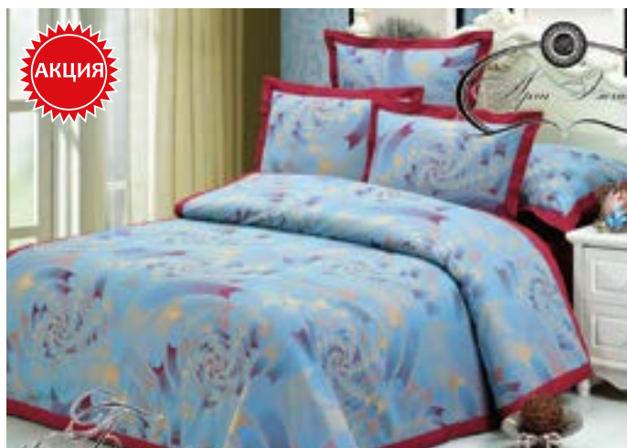
Беатрис 2,0 сп. Евро - арт. 776