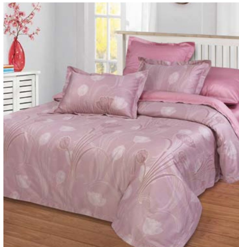
ИЗЫСК 2,0 сп. Евро - арт. 886 Евро - арт. 887