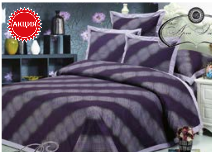
Валери 2,0 сп. Евро - арт. 776