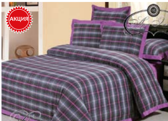
Доменико 2,0 сп. Евро - арт. 776