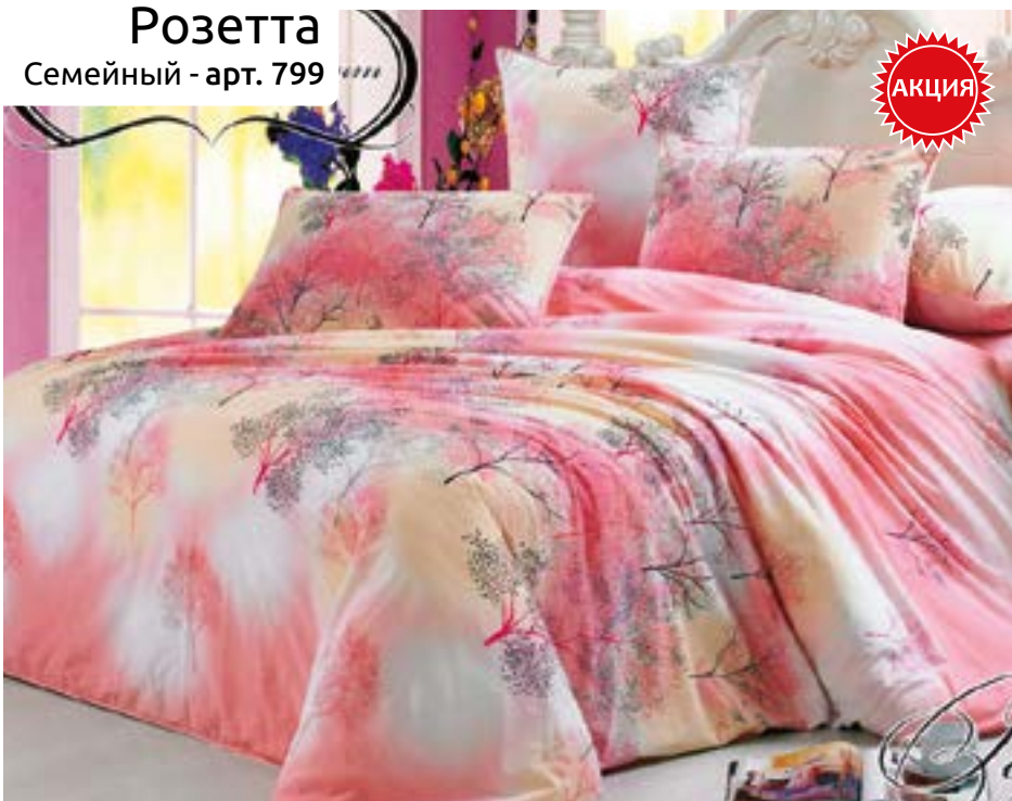
Розетта Семейный - арт. 799