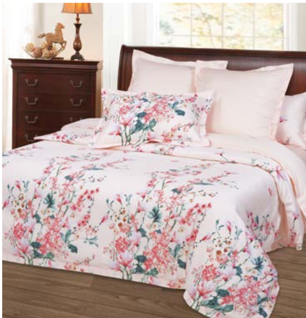
Милагрес Евро - арт. 887