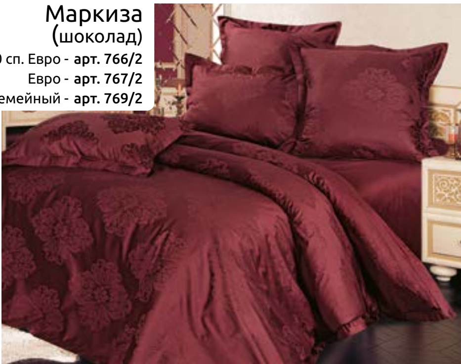
Маркиза (шоколад) 2,0 сп. Евро - арт. 766/2 Евро - арт. 767/2 Семейный - арт. 769/2